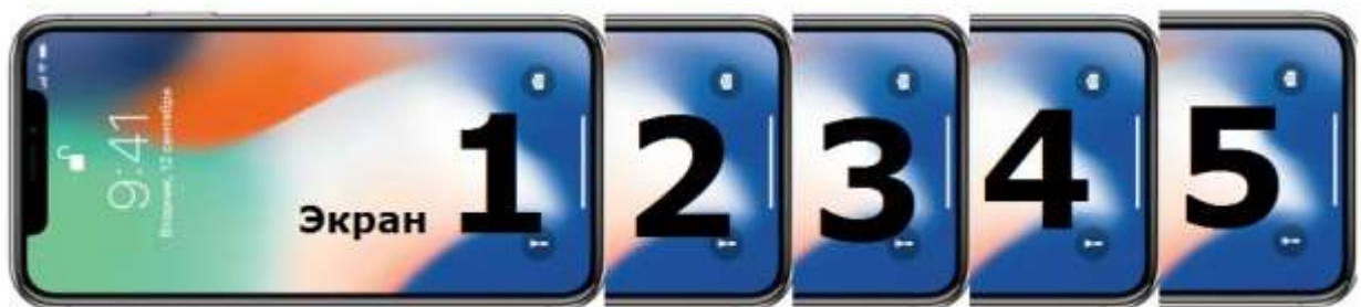
Циклически само-сменяемые экраны evr.st

Есть веб-дизайнеры, которые думают в этом направлении. ТехТерра на своём сайте приводит положительный пример посадочной страницы evr.st , обходящейся без скроллинга. Страница продвигает приложение для мобильных телефонов. Описания возможностей программы автоматически сменяются на экране одно за другим.