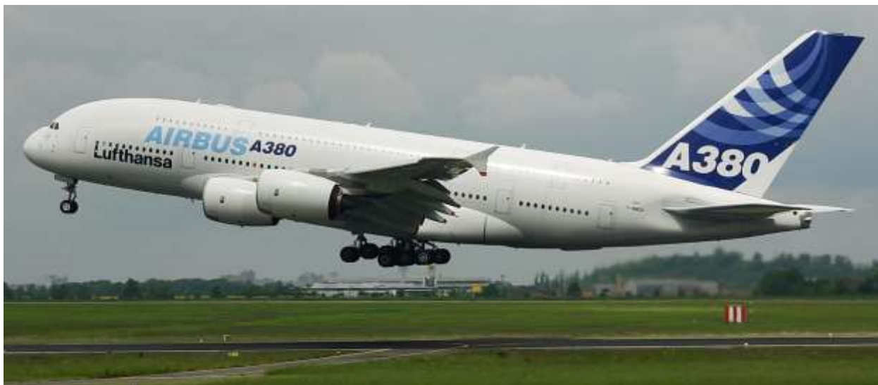
Airbus A-380 с двухэтажным салоном

Уже сформированы секторы рынка, в которых конкурирующие производители поимённо знают всех потенциальных покупателей. Компания Airbus S.A.S. выпускает самый большой в мире авиалайнер A-380 на 800 пассажиров. Самолёт высотой с девятиэтажный дом, длиной-шириной с футбольное поле. Рынок этого продукта своеобразен. За 17 лет маркетинговых усилий Airbus законтрактовал 317 самолетов, из которых 216 уже поставил заказчикам.